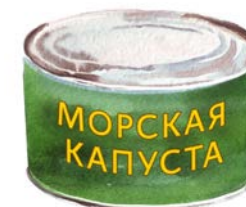
И ДАЖЕ ВОДОРОСЛИ